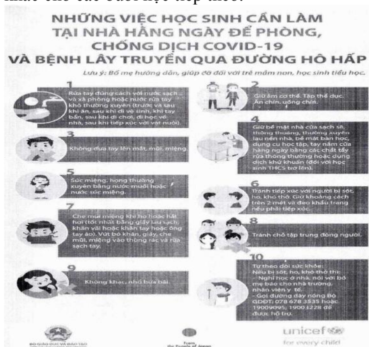
Hình 7. Những việc học sinh cần làm tại nhà hàng ngày để phòng, chống dịch COVID-19 và bệnh lây truyền qua đường hô hấp.

- Kiểm tra, rà soát, bổ sung kịp thời nước sát khuẩn, xà phòng và các vật dụng khác cho các buổi học tiếp theo.