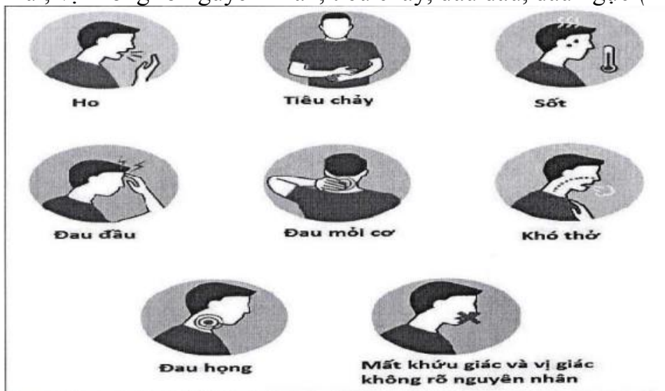
Hình 2. Các triệu chứng có thể gặp khi mắc COVID-19

Sau khi nhiễm vi rút SARS-CoV-2, các triệu chứng của bệnh COVID-19 có thể xuất hiện trong vòng 2-14 ngày, trung bình 5 ngày, người bị nhiễm vi rút có thể có các triệu chứng sau: Ho, sốt, khó thở, đau mỏi cơ, đau họng, không cảm nhận được mùi, vị không rõ nguyên nhân, tiêu chảy, đau đầu, đau ngực (Hình 2).