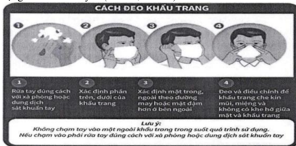
Hình 4: Cách đeo khẩu trang đúng cách

b. Đeo khẩu trang đúng cách nơi công cộng, trên phương tiện giao thông công cộng và đến cơ sở y tế (Hình 4, Hình 5).