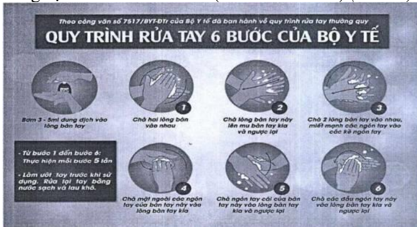
Hình 3: Các bước rửa tay theo hướng dẫn của Bộ Y tế

a. Thường xuyên rửa tay đúng cách bằng xà phòng dưới vòi nước sạch, hoặc bằng dung dịch sát khuẩn có cồn (ít nhất 60% cồn) (Hình 3).