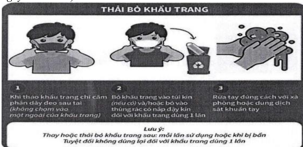
Hình 5: Cách tháo bỏ khẩu trang đúng cách