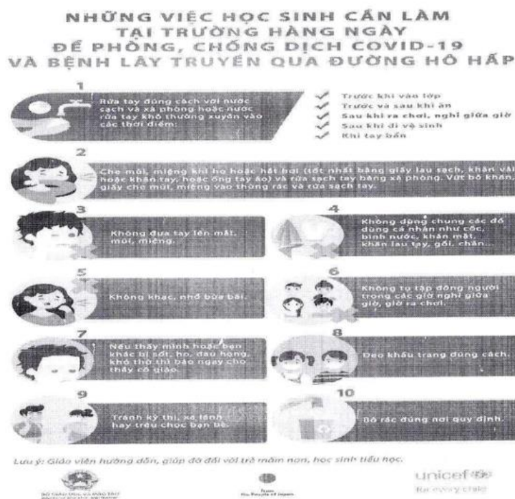
Hình 6. Những việc học sinh cần làm tại trường hàng ngày để phòng, chống dịch COVID-19 và bệnh lây truyền qua đường hô hấp.

b. Nhà trường quy định, hướng dẫn học sinh thực hiện những việc cần làm như sau (Hình 6):